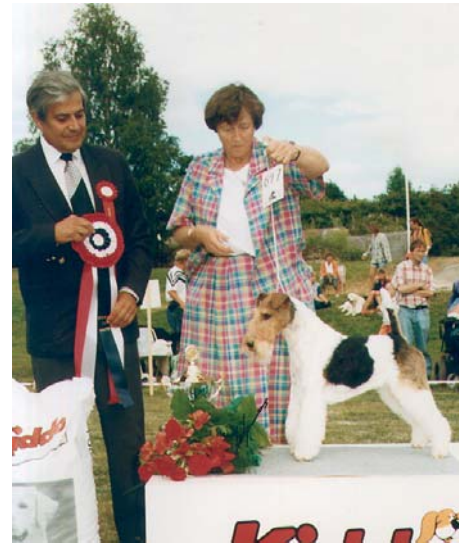
Int Nord GB Am Uch NV96 Burrendale Escort of Purston

- Junior Amsterdamvinner-04 Waggers's Dutch Commander.