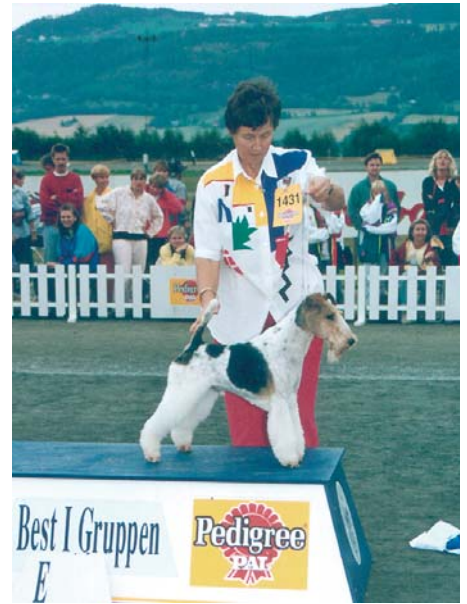
Int GB Am N S Uch NV93 Louline Heartbreaker

Grethe Bergendahls nederlandske venninne hadde paret ei tispes med Ben, så de eier nå en hannhund fra det kullet sammen