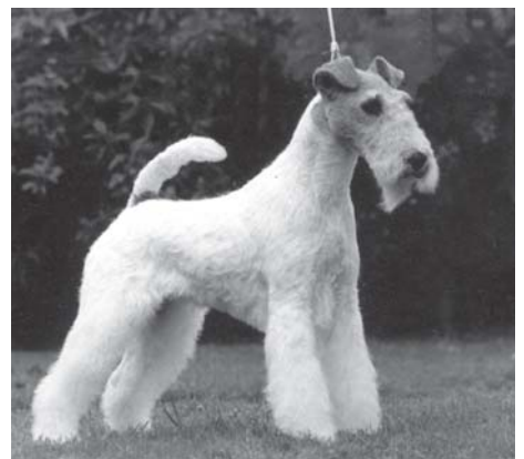
Fra venstre: Int Nord Uch NV94 NordV94 Marstens Boomerang - nr 2 Topp Terrier 1994. Foto i midten: Int Nord Uch NV95 EUV97 NordV98 Marstens Wonky Monkey, Grethe Bergendahls kanskje beste fox noensinne. Foto til høyre: Int Nord Uch NV00 Marstens Busy ble Årets Terrier i 2000, en av de 13 gangene Grethe Bergendahl har vunnet.